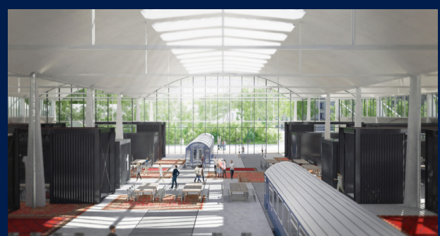
4 juillet 2017 - Installation de ShareIT à Station F.