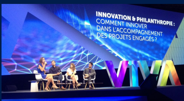
17 juin 2017 - Lancement de ShareIT sur VivaTechnology.

Le choix de l'écosystème STATION F est tout sauf un hasard pour Ashoka, qui défend depuis plus de 35 ans les vertus du décloisonnement et de la co-création, pour répondre aux problématiques sociales majeures. Au sein du plus grand campus d'entrepreneurs au monde, Ashoka souhaite faire la démonstration qu'il existe parmi les startups tech des solutions et des compétences dans lesquelles résident quelques unes des réponses aux grands enjeux sociétaux de notre époque. Les 1000 startups présentes à STATION F sont toutes des entreprises sociales en puissance : à ShareIT de révéler le potentiel social de chacune, en créant des synergies avec les entrepreneurs sociaux les plus innovants.