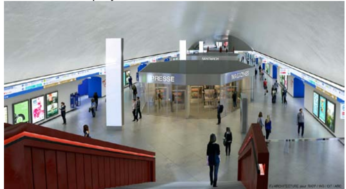
La salle des échanges – Etat actuel/état projeté