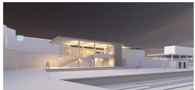
Façade du bâtiment voyageur niveau « quais » de l'accès Ouest – Etat actuel/état projeté