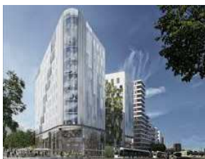
Chapelle International, Paris (75)