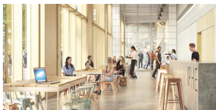
IPHE Paris-Saclay, Saclay (91)