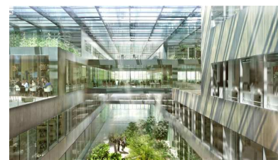
Greencity, Zürich (Suisse)