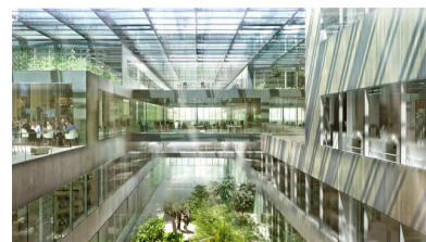
Confluence, Lyon (69)

Pour répondre à ces enjeux, Bouygues Construction a constitué une boîte à outils de plus de 200 solutions innovantes en mobilisant ses équipes de R&D et d'ingénierie complétées par un vaste écosystème de partenaires (startups, ETI et grandes entreprises).