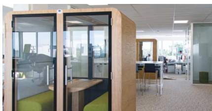
Parc actif, Lormont (33)