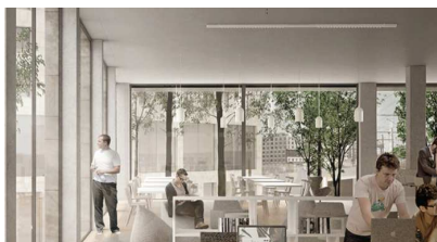
Îlot fertile, Paris (75)

Bureaux ouverts sur l'extérieur, partage des ressources et des services à d'autres utilisateurs, systèmes et équipements ouverts et interopérables pour faciliter l'exploitation du bâtiment et les services, anticipation de la réversibilité des espaces, etc.